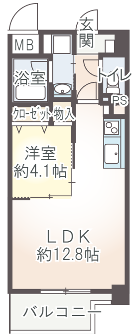
A1' type 1LDK 40.42㎡ ■ 1Fバルコニー面積/4.23㎡ ■ 2F～6Fバルコニー面積/6.45㎡