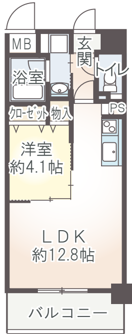
A1 type 1LDK 40.42㎡ ■ 1Fバルコニー面積/5.81㎡ ■ 2F～6Fバルコニー面積/6.45㎡