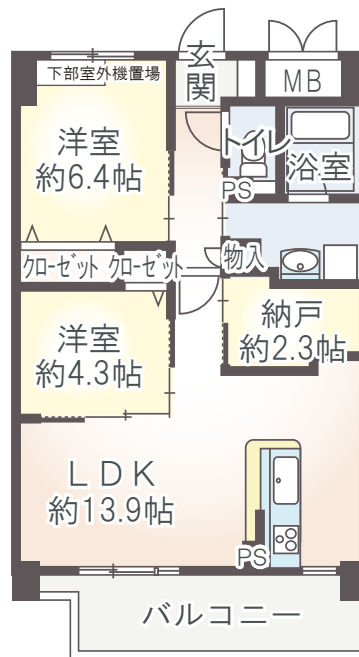
B1 type 2LDK+納戸 60.16㎡ ■ 2Fバルコニー面積/8.70㎡ ■ 3F～6Fバルコニー面積/9.60㎡