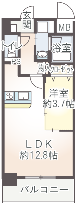
A3 type 1LDK 40.42㎡ ■ 1Fバルコニー面積/5.81㎡ ■ 2F～6Fバルコニー面積/6.45㎡