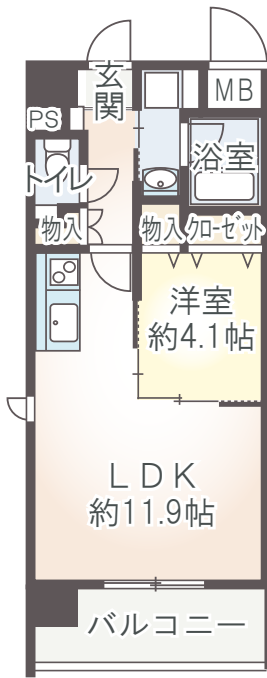
A2 type 1LDK 40.42㎡ ■ 1Fバルコニー面積/5.81㎡ ■ 2F～6Fバルコニー面積/6.45㎡