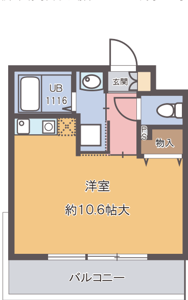
A type 1R 28.08㎡