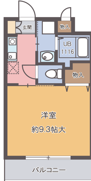
B2 type 1K 28.38㎡