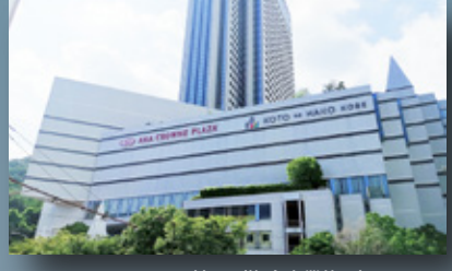
コトハコ神戸(複合商業施設) 徒歩2分(約156m)