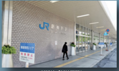
新幹線「新神戸駅」 徒歩7分(約482m)