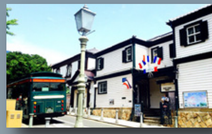
神戸異人館街(北野町2丁目) 徒歩8分(約618m)