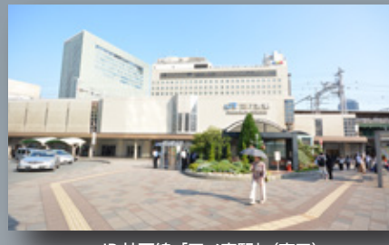
JR神戸線「三ノ宮駅」(東口) 徒歩13分(約1004m)