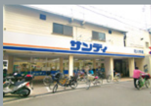
サンディ塚本店 (スーパーマーケット) 徒歩 4 分 (約 258m)