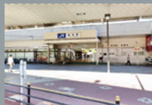
JR 塚本駅西口 徒歩 6 分 (約 514m)