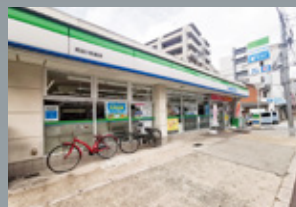
ファミリーマート 西淀川 柏里店 徒歩 5 分 (334m)