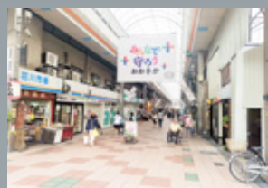
サンリバー 柏里商店街 徒歩 4 分 (西入口まで約 245m)