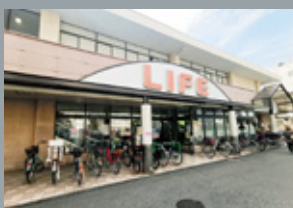
ライフ塚本店 (スーパーマーケット) 徒歩 5 分 (約 349m)