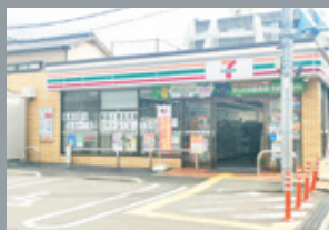
セブンイレブン JR 塚本駅西店 徒歩 2 分 (約 125m)