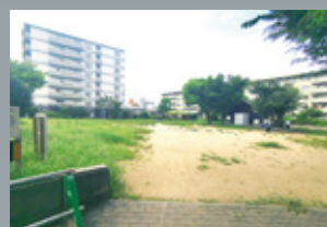
柏里西公園 徒歩 3 分 (226m)