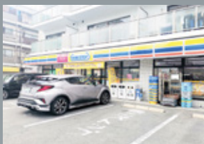
ミニストップ 柏里 2 丁目店 徒歩 2 分 (約 147m)