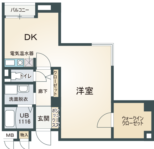
B type 1DK 45.23㎡