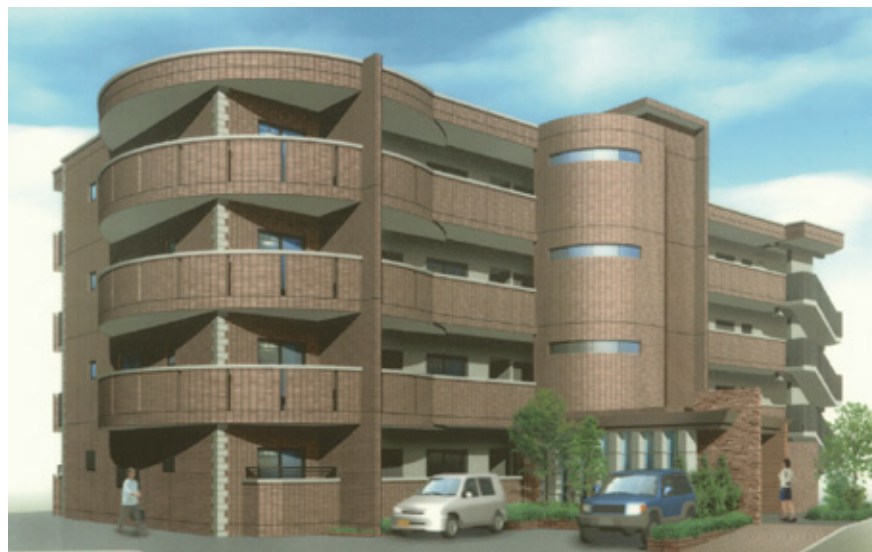
※上図は実際とは異なる場合がございますので予めご了承下さい。

※高松あんしんサポート対応 1,000円/月 ※指定保証会社加入が条件となります。(保証会社費用は契約者様負担)