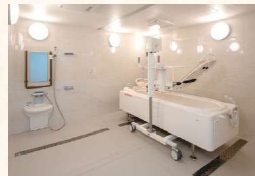
入浴が難しい方でも入浴可能な機械浴槽完備