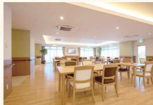
会話も弾む、ゆったりとした食堂スペース