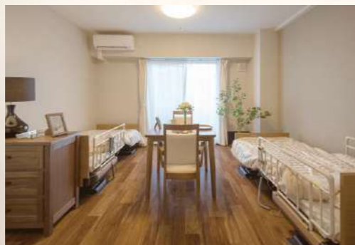
夫婦の時間が楽しめるプライベートルーム